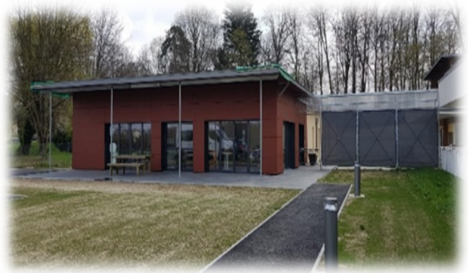
La Maison d'Accueil Spécialisée