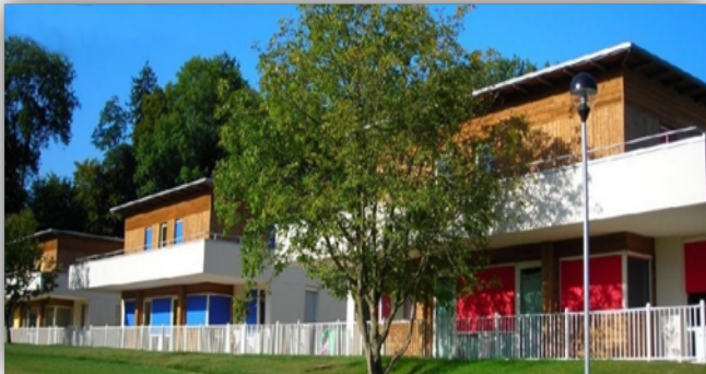
Le Centre Médico-Educatif et le SESSAD