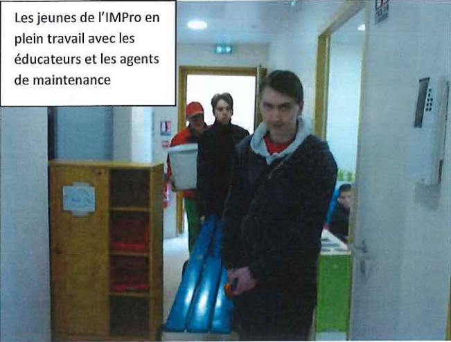
Les jeunes de l'IMPro en plein travail avec les éducateurs et les agents de maintenance