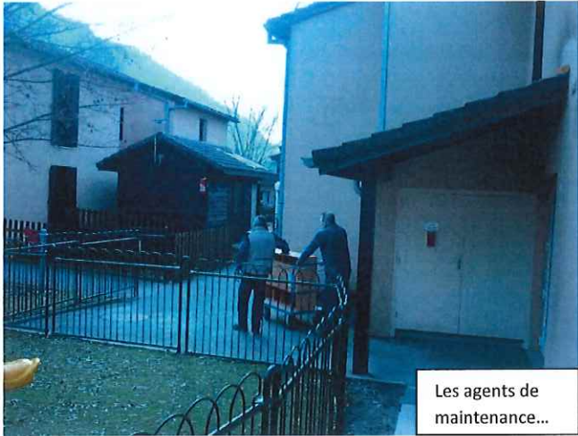
Les agents de maintenance...