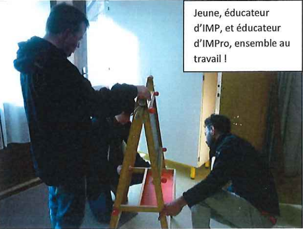
Jeune, éducateur d'IMP, et éducateur d'IMPro, ensemble au travail !