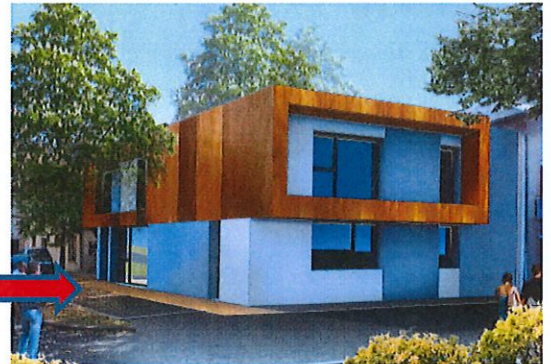
VUE DEPUIS LE PARKING

Les travaux vont être réalisés par l'entreprise Barel et Pelletier. Ils débuteront le 3 avril prochain. Les deux premières semaines seront destinées à l'organisation du chantier :