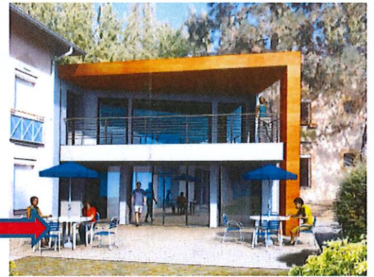
VUE DEPUIS LE PARC