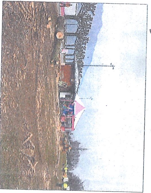
Deux nouveaux arbres ont été coupés par les bûcherons de l'ONF hier matin.

Haut se sont affairées à ras-sembler et broyer les bran-ches pour nettoyer les pelouses de ces déjeuners vé-