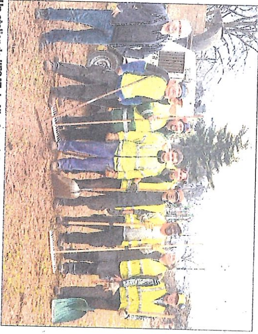
Un atelier de l'ESAT du Nivolet a été mandaté pour assurer le nettoyage des déchets végétaux.

Pour eux, dans le cas de grand vent, les arbres re-présentaient un réel dan-ger pour leur clientèle, ajoutant que le pollen dis-persé pouvait incommoder certains clients allergi-ques.